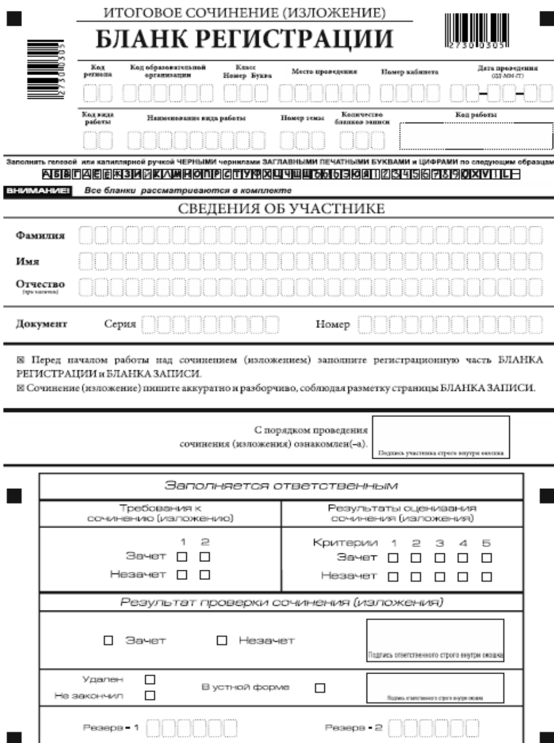
Рис. 1. Бланк регистрации

В верхней части бланка регистрации (рис. 2) расположены: